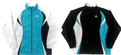
XLW-4797 ターコイズ×ホワイト