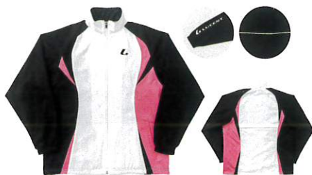
XLW-4790 ホワイト×ブラック JP

コストパフォーマンスよし 練習・試合の前後など、 体温を効率的にキープしてくれる ジルコサーモ採用ウェア